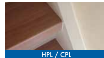
HPL / CPL

Wij werken met verschillende soorten materialen, zoals eikenhout, pvc en HPL/CPL, om je trap weer veilig, mooi en slijtvast te maken. Naast ledverlichting voor de trap hebben we ook bijpassend laminaat en trapeleuningen in rvs of (blauw)staal.